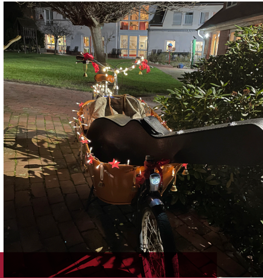
Lebendiger Advent bei A&A