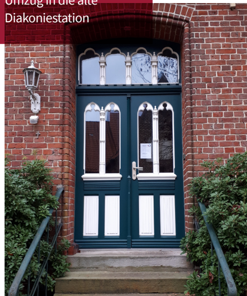
Umzug in die alte Diakoniestation