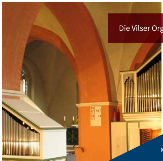
Die Vilser Orgel

Neben der Reinigung stehen auch kleinere Reparaturen an. Es wurden Undichtigkeiten am Blasebalg festgestellt, der das ganze Orgelwerk mit Luft versorgt, dem sogenannten „Orgelwind“. Zudem muss die Mechanik für das Rückpositiv überarbeitet werden. Sie liegt unter dem Bretterboden, über den der Orgelspieltisch zugänglich ist. Es kommt immer wieder zu „Reibereien“. So bleiben speziell bei bestimmten klimatischen Verhältnissen einzelne Töne hängen; es entstehen die typischen „Heuler“. Es gibt genügend zu tun, um die Orgel wieder richtig flott zu bekommen. Mit dem erfolgreichen Verlauf der Spenden-Gala am 17. September sind wir zuversichtlich, die notwendige Maßnahme bald in Auftrag zu geben.