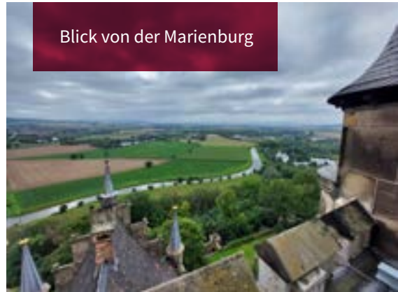
Blick von der Marienburg

Im Schlossrestaurant wurden wir gut mit vorbestellten Speisen und Getränken versorgt. Dann ging es nach Hannover zum Neuen Rathaus. Dort stieg unser Reiseleiter zu, führte den Busfahrer durch Hannovers engste Kurven und berichtete gleichzeitig von vielen Gebäuden, Ereignissen und Anekdoten der Stadt und berühmten Bürgern. Danach standen nahe dem Georgengarten