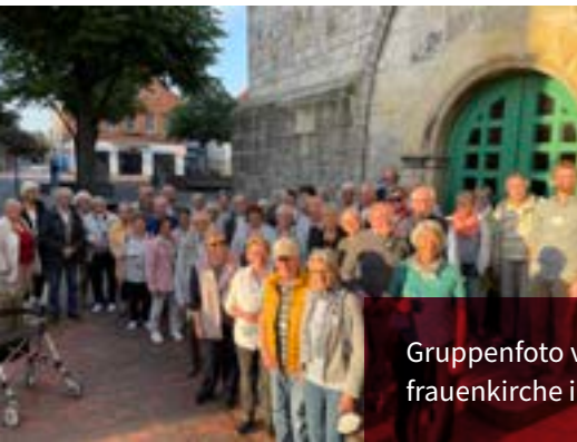
Gruppenfoto vor der Liebfrauenkirche in Neustadt a. Rbge