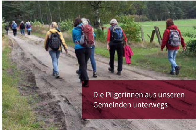
Die Pilgerinnen aus unseren Gemeinden unterwegs

Teilnehmerinnen haben zum ersten Mal in einem Kloster übernachtet und waren begeistert vom Kreuzgang, der alten Kirche, den dicken Klostermauern und den alten Möbeln und Öfen – alles sorg-