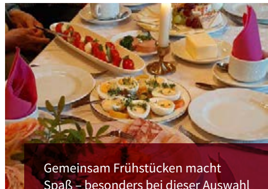
Gemeinsam Frühstücken macht Spaß – besonders bei dieser Auswahl

Viele Menschen sitzen morgens alleine am Frühstückstisch. Das muss nicht sein. Beim Gemeindefrühstück bereitet ein engagiertes Team ein Frühstücksbüfett vor, das sich zeigen lässt. Zum Anfang gibt es eine Andacht und gegen Ende erzählen wir uns kleine Geschichten, Anekdoten oder Witze. Und dazwischen ist viel Zeit zum Schlemmen und Schnacken. Das Team freut sich auch hier über neue Gesichter. Denn gemeinsam Frühstücken macht Spaß!