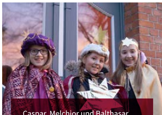
Caspar, Melchior und Balthasar bringen Gottes Segen in die Häuser

Am 4. und 5. Januar gehen wieder die Sternensinger_innen durch den Ort und schreiben den bekannten Segen an die Häuser. Im neuen Jahr wird die Sternensinger_innenaktion erstmals ökumenisch sein! Wer möchte, dass die Sternensinger_innen auch sie besuchen, melde sich gerne. Anmeldungen gehen an Mareike Hinrichsen-Mohr (04252 2201).