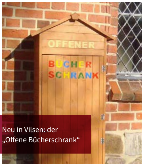
Neu in Vilsen: der „Offene Bücherschrank“

Auf dem Kirchplatz in Vilsen gibt es eine Neuigkeit: Den „Offenen Bücherschrank“. Er steht allen offen, um sich dort ein Buch zu nehmen, ein Buch hinein zu stellen oder ein gelesenes gegen ein anderes Buch zu tauschen. Zur Auswahl werden auch Kinderbücher stehen. Wir hoffen auf rege Annahme des Angebots und wünschen viel Spaß.