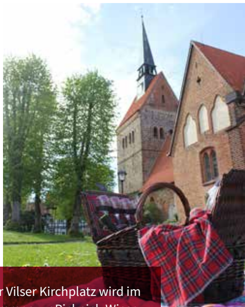
Der Vilsener Kirchplatz wird im Sommer zur Picknick-Wiese

und 8. August) soll Gelegenheit sein zusammen zu kommen, das Mitgebrachte zu verzehren, zusammen zu reden und zu lachen oder einfach die Abendsonne auf einem der schönsten Plätze in Bruchhausen-Vilsen zu genießen. Also, packen Sie den Picknickkorb, wir freuen uns auf gemeinsame Sommerabende! (Nur wenn es Regen gibt, muss das Picknick leider ausfallen.)