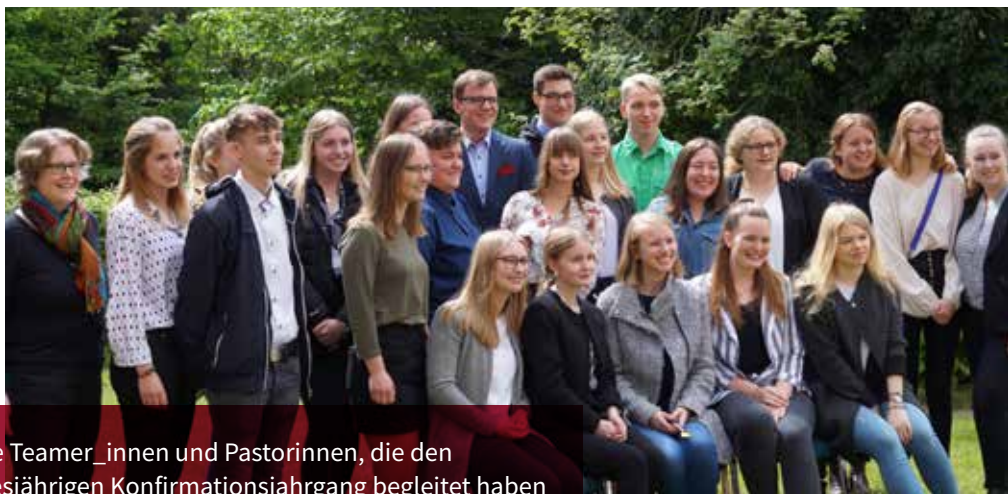
Die Teamer_innen und Pastorinnen, die den diesjährigen Konfirmationsjahrgang begleitet haben