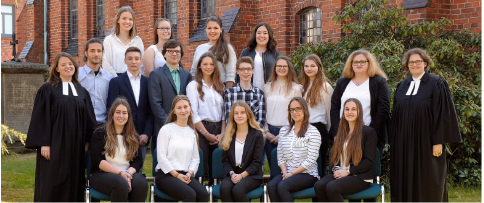
Die Teamer_innen und Pastorinnen, die den diesjährigen Konfirmationsjahrgang begleitet haben

Ganz besonders freue ich mich über die vielen Teamer_innen, die diesen Konfirmand_innenjahrgang begleitet haben und den Unterricht, die Freizeit und die Andachten gestaltet haben. Auch die Ideen für die Konfirmationen haben wir gemeinsam gesammelt und umgesetzt. Wir als Kirchengemeinden können Gott