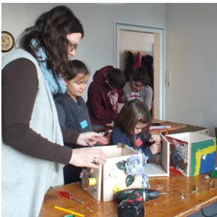
Sägen, kleben, malen: während der Abenteuerkirche entstand das neue mobile Kreuz

Das Titelbild des Gemeindebriefes zeigt es: die Kinder der Abenteuerkirche haben ein großes Projekt erfolgreich beendet. Sie haben ein mobile Kreuz für unsere Kirchengemeinden gebastelt. Mit viel Liebe und Herzblut fertigten die kleinen und großen Handwerker die einzelnen Platten und Kästen. Das Ergebnis war erstmals beim Himmelfahrtsgottesdienst in Bruchhausen zu bewundern und ist wieder beim Gottesdienst an der Behlmer Mühle zu sehen. Kommen Sie doch vorbei und bewundern Sie das Kreuz selbst. Aber nicht nur das Kreuz wurde gebastelt. Auch die Osterkerze kann sich sehen lassen. Unsere Mitarbei-