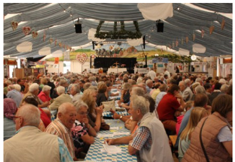
Volles Zelt – auch beim Gottesdienst!

Am 27. August 2017 findet wieder ein gemeinsamer Gottesdienst der Gemeinden auf dem Brokser Markt statt. Der Gottesdienst beginnt um 10 Uhr im „Remmer-Zelt“. Die Gestaltung übernehmen die Pastor_innen der Region, sowie der Posaunenchor.