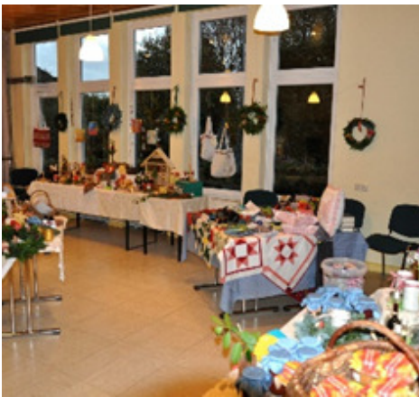
Wenn das Brokser Gemeindehaus zum Basar wird: die Verkaufsstände des Kreativkreises

Bist du ein kreativer Kopf und hast ebensolche Hände? Wolltest du schon immer einmal deine tollen Ideen in die Tat umsetzen und dich mit anderen darüber austauschen? Dann bist du genau richtig in unserem Kreativkreis in Bruchhausen! Seit zehn Jahren gibt es unsere Gruppe schon. Und in diesen zehn Jahren haben wir viel geschafft. Zur Zeit verfügen wir über 22 geschickte und motivierte Hände, die jährlich zum Gemeindebasar in Bruchhausen wunderschöne Dinge nähen, stricken, basteln, kochen und Holz werkeln. Die Erlöse des Basars sind jedes Jahr für einen besonderen Zweck in der Gemeinde bestimmt.