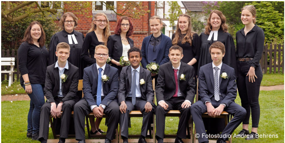
Konfirmation am 7. Mai 2017: aus datenschutzrechtlichen Gründen sind die Namen der Konfirmierten nur in der Druckausgabe des Gemeindebriefes abgedruckt