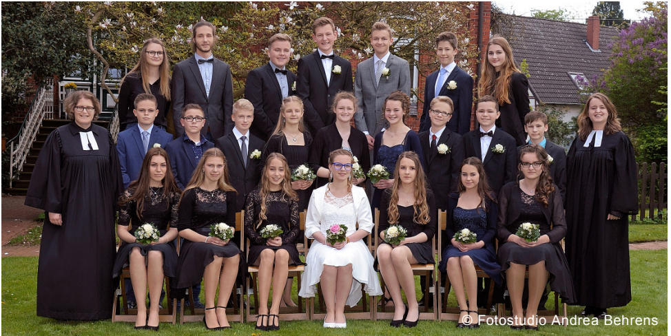
Konfirmation am 6. Mai 2017: aus datenschutzrechtlichen Gründen sind die Namen der Konfirmierten nur in der Druckausgabe des Gemeindebriefes abgedruckt