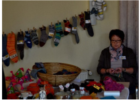
Unsere Mitglieder zeigen auch beim Basar ihr Können

So konnte durch den Erlös des letzten Basars ein neuer Satz an Gesangbüchern in Großdruck für das Gemeindehaus gekauft werden. In diesem Jahr findet der Basar am Sonntag, den 5. November 2017 im Gemeindehaus statt. Und bis dahin gibt es noch viel zu tun. Wir sind immer auf der Suche nach neuen kreativen Menschen und Ideen, die unsere Gruppe bereichern. Haben wir dein Interesse geweckt? Dann sei von ganzem Herzen bei uns willkommen! Für Fragen bezüglich unserer Treffen stehe ich gerne zur Verfügung (Telefon 04252/2180). Wir freuen uns schon jetzt auf dich und deine Ideen!