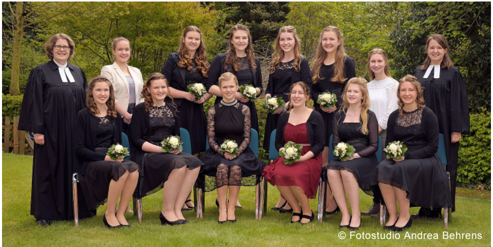
Konfirmation am 29. April 2017: aus datenschutzrechtlichen Gründen sind die Namen der Konfirmierten nur in der Druckausgabe des Gemeindebriefes abgedruckt