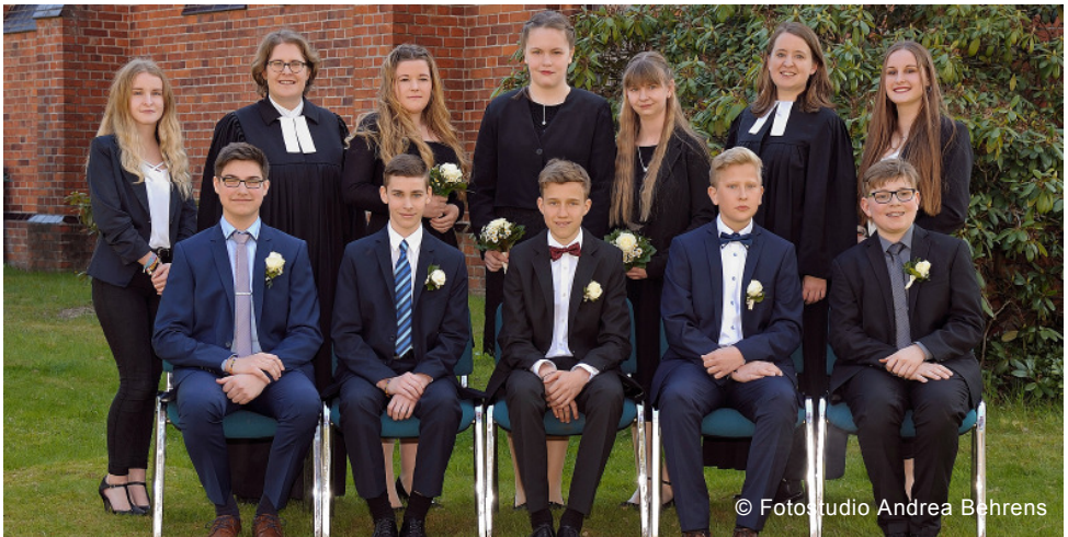
Konfirmation am 30. April 2017: aus datenschutzrechtlichen Gründen sind die Namen der Konfirmierten nur in der Druckausgabe des Gemeindebriefes abgedruckt