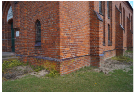
Nachdem alle Büsche entfernt wurden, können die Bauarbeiten für den neuen Zugang beginnen

nalprobleme nur bedingt arbeitsfähig war. Nicht nur das Brokser Bauprojekt musste darum lange warten, sondern auch in anderen Gemeinden konnte in den letzten Jahren kein einziger Stein verbaut werden. Wir sind froh, dass es jetzt aber endlich losgeht.