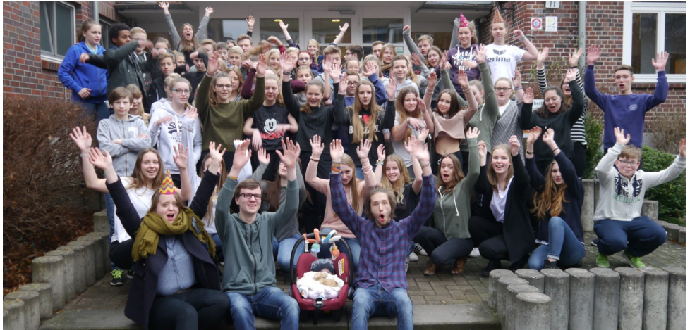
Der Konfirmationsjahrgang 2017