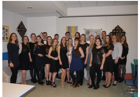
Die Teamer_innen freuen sich auf die Konfirmation

Besondere Momente gab es auf unserer Konfirmandenfahrt viele. Vom 2.-5. Februar sind wir mit unseren Teamern auf Konfirmandenfahrt nach Stade gefahren. mitten in der Stadt war unsere Jugendherberge- ganz für uns allein- die Basis für Action, Spiel und unsere Beschäftigung mit dem Abendmahl. Gemeinschaft ist das Wichtigste dabei - mit Gott und mit den anderen. Nachdem die erste Nacht er-