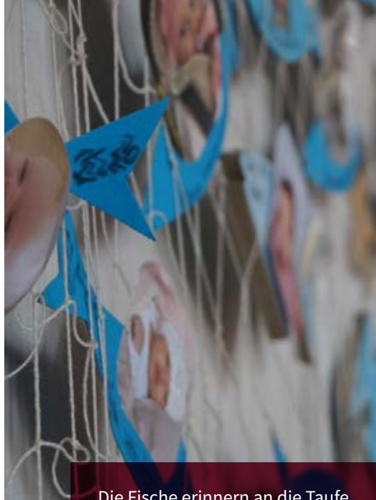
Die Fische erinnern an die Taufe

Aufgrund des verheerenden Hochwassers in Deutschland wurde die Kollekte der Sommerkirche für die Diakonie Katastrophenhilfe gesammelt. Wir danken allen Geber*innen. Spenden sind weiterhin willkommen. Die Bankdaten lauten: Diakonie Katastrophenhilfe, Evangelische Bank, IBAN: DE68 5206 0410 0000 5025 02, BIC: GENODEF1EK1. Informationen zur Verwendung der Spenden finden Sie unter www.diakoniekatastrophenhilfe.de