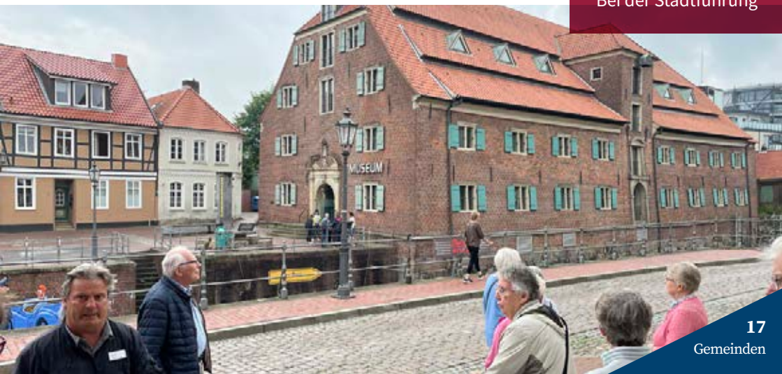
Bei der Stadtführung