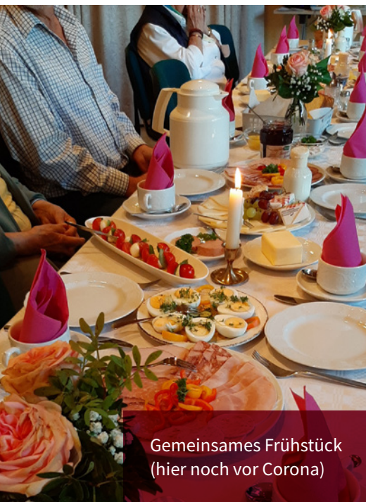
Gemeinsames Frühstück (hier noch vor Corona)

Broksen auch 2021 ohne Basar? Der Kreativkreis und Kirchenvorstand arbeiten an einem Konzept, wie der Basar auch unter den aktuell geltenden Regeln stattfinden kann. Details zu den Planungen werden wir vor dem Basar in der Tagespresse und auf der Homepage veröffentlichen. Der Tag startet mit der Feier eines Gottesdienstes um 11 Uhr in der Brokser Kirche.