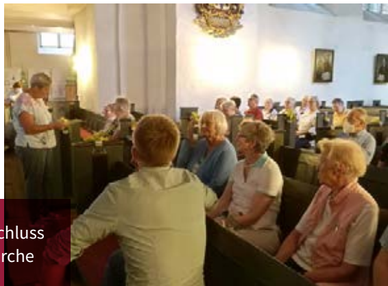
Der Abschluss in der Kirche

Welche Schuhe haben wir und wie passt das zu unseren verschiedenen Lebenssituationen? Sogar spontanes Singen war in der schönen Kirche wieder möglich. Nach einem Abschlussgebet machten wir