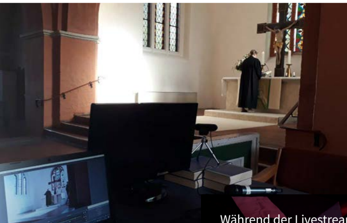
Während der Livestreams auf dem Orgelboden

Als es während des Lockdowns im Frühjahr keine öffentlichen Gottesdienste gab, da schrieben unsere Pastor_innen Andachten in Wort, Ton und als Film und wir stellten sie auf der Homepage zur Verfügung. In der Zwischenzeit hat sich einiges im technischen Hintergrund geändert: Vom Vilser Gemeindebüro aus versorgt ein Glasfaserkabel die Vilser Kirche jetzt mit einem Internetanschluss. Und ein neues Laptop ermöglicht YouTube-Livestreams von Gottesdiensten aus der Vilser Kirche.