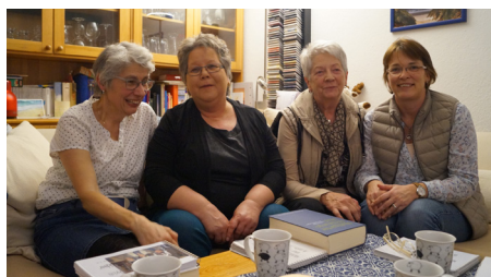
Bei Kaminfeuer und Tee: der besondere Hauskreis

meinschaft, übt sich der Hauskreis im „Bibelteilen“ - eine Methode, bei der jede ihren persönlichen Zugang zu einem biblischen Text einbringen kann. Am Ende steht eine Collage aus Ideen, Fragen und Beobachtungen. Durch diese Art des Bibellesens nehmen alle immer wieder viele Anregungen, Trost und Ermutigung mit. Am Ende des Abends steht der gemeinsame Segen, den sich alle zusprechen, und die Vorfreude auf das nächste Treffen – sei es in Sudwalde, Staffhorst, Vilsen oder Broksen!