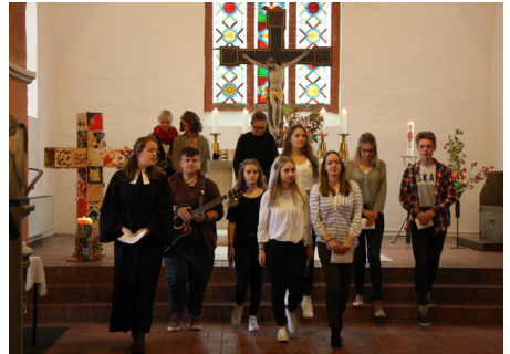
Unsere Teamer_innen beim Gottesdienst zum Reformationstag

wir gemeinsam Kirche sind! Das haben wir auch in den nächsten Tagen bei einigen Andachten gespürt, die wir als Jugendliche im Teamertreff oder im Konfirmandenunterricht gefeiert haben: Gott ist dabei. Was für ein guter Grund zum Feiern!