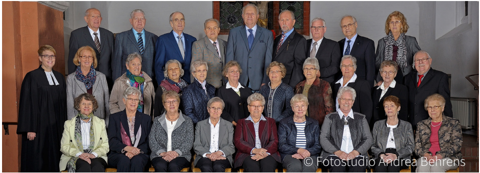
Diamantene Konfirmation in Vilsen am 21. Oktober 2017 (Jahrgang 1956): Aus datenschutzrechtlichen Gründen sind die Namen nur in der Druckausgabe des Gemeindebriefes abgedruckt.