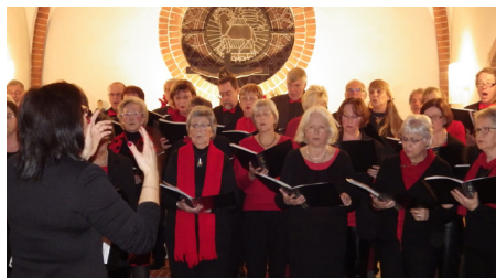
Wenn die Brokser Kirche kräftig klingt: Das Adventskonzert von „Kaleidoskop“