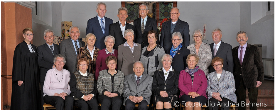
Diamantene Konfirmation in Vilsen am 22. Oktober 2017 (Jahrgang 1957): Aus datenschutzrechtlichen Gründen sind die Namen nur in der Druckausgabe des Gemeindebriefes abgedruckt.