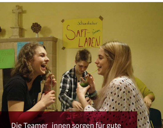
Die Teamer_innen sorgen für gute Stimmung im Broker „Wahl-Lokal“

Ein großer Dank gilt allen, die sich rund um die Wahl engagiert haben und natürlich auch allen Wähler_innen die mit Ihren Stimmen unseren neuen Kirchenvorständen den Rücken stärken.