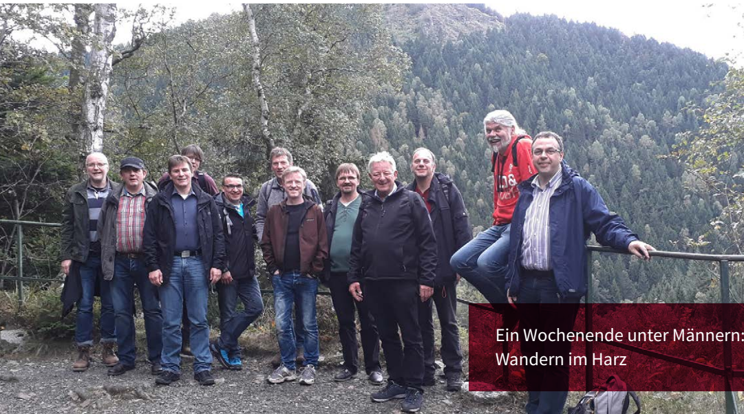
Ein Wochenende unter Männern: Wandern im Harz