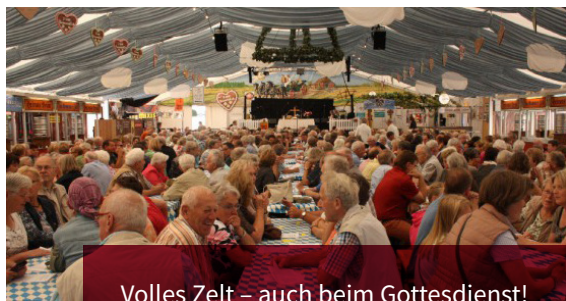
Volles Zelt – auch beim Gottesdienst!

Am 26. August findet wieder ein gemeinsamer Gottesdienst auf dem Brokser Markt statt. Der Gottesdienst beginnt um 10 Uhr im „Remmer-Zelt“. Die Gestaltung übernehmen die Pastorinnen und Pastoren der Region, sowie der Posaunenchor.