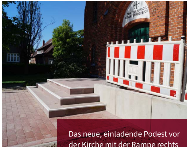
Das neue, einladende Podest vor der Kirche mit der Rampe rechts

Persönlich möchte ich dem alten Kirchenvorstand für sein unermüdliches Engagement bei diesem Projekt danken – er hat sich nicht entmutigen lassen, sondern immer wieder mit Nachdruck die Planungen vorangebracht. Umso schöner ist es, dass die Arbeiten zum Ende der Amtszeit des Kirchenvorstands noch abgeschlossen werden konnten.