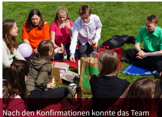
Nach den Konfirmationen konnte das Team entspannen: alles hat wunderbar geklappt!

In Vilsen haben wir uns ins Wunderland aufgemacht – denn Gottes Liebe