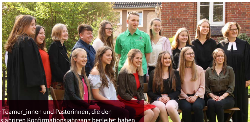
Die Teamer_innen und Pastorinnen, die den diesjährigen Konfirmationsjahrgang begleitet haben