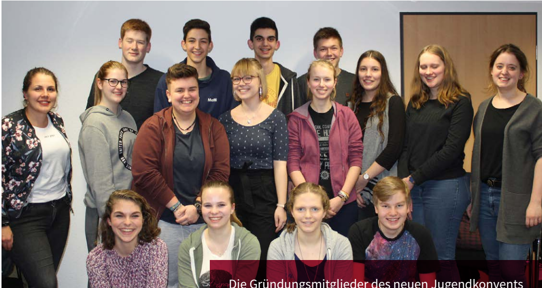
Die Gründungsmitglieder des neuen Jugendkonvents