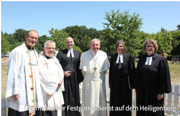
Ökumenischer Festgottesdienst auf dem Heiligenberg