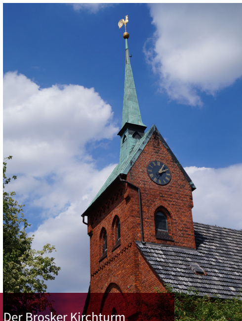
Der Brosker Kirchturm braucht Ihre Unterstützung!

dann im Turm ausgehängt. Die Gemeinde freut sich über alle, die gemeinsam mit uns in die Zukunft des Kirchturms investieren um so ein Wahrzeichen von Broksen auch für künftige Generationen zu bewahren. Spenden können mit dem Stichwort „40x40“ und dem jeweiligen Namen an das Konto der Kirchengemeinde Bruchhausen überwiesen werden (siehe Seite 26). Wir danken allen, die uns bei diesem wichtigen Vorhaben unterstützen!