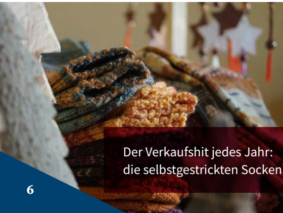
Der Verkaufshit jedes Jahr: die selbstgestrickten Socken