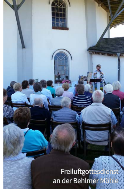
Freiluftgottesdienst an der Behlmer Mühle