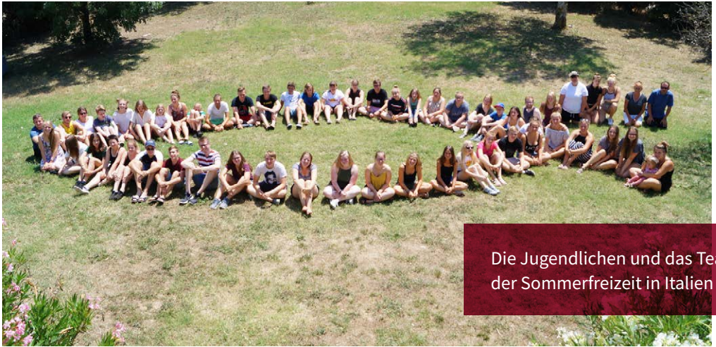
Die Jugendlichen und das Team der Sommerfreizeit in Italien

Sonne und Spaß, Lachen und Singen, Nachdenken und dabei braun werden – so lässt sich wohl unsere Sommerfreizeit in Italien gut zusammenfassen! Mit 57 Jugendlichen und einem tollen Team haben wir uns in die Toskana aufgemacht, um gemeinsam eine ganz besondere Gemeinschaft zu erleben. Dabei waren wir nicht allein – in der Gruppe ist schon früh eine besondere Verbundenheit entstanden und wir haben Gottes Segen in unseren Traumstunden, im Gottesdienst, beim Reden über das Leben und den Glauben und auch in den Aktionen und im Spaß erleben können! Wir haben auf Ausflügen im Meer gebadet, haben den schiefen Turm von Pisa gesehen und Florenz erlebt. Es war eine unvergessliche Zeit auf unserem Berg in der Toskana und wir bedanken uns bei allen, die das möglich gemacht