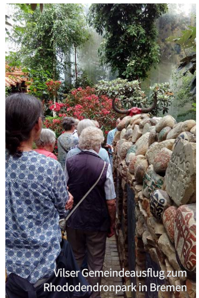
Vilser Gemeindeausflug zum Rhododendronpark in Bremen