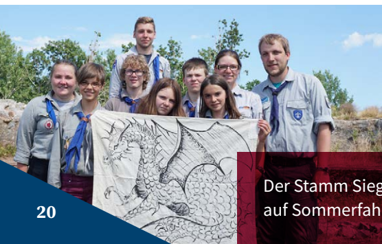
Der Stamm Siegfried von Xanten auf Sommerfahrt in Norwegen

PS: Ja, wir haben tatsächlich zwei Elche in freier Wildbahn gesehen!