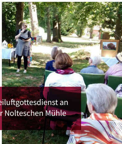
Freiluftgottesdienst an der Nolteschen Mühle