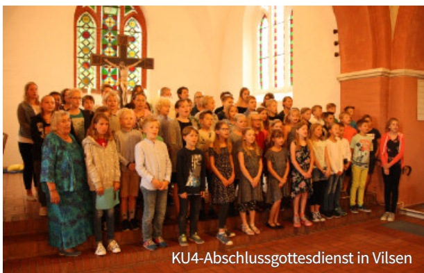
KU4-Abschlussgottesdienst in Vilsen