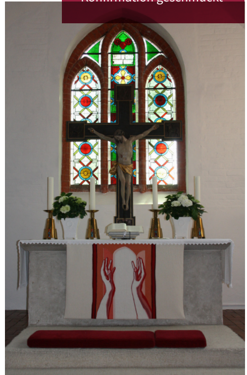
Der Altarraum in Vilsen zur Konfirmation geschmückt