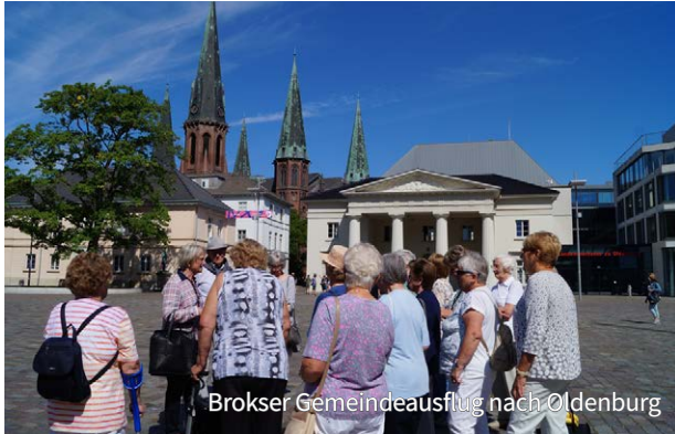
Brokser Gemeindeausflug nach Oldenburg